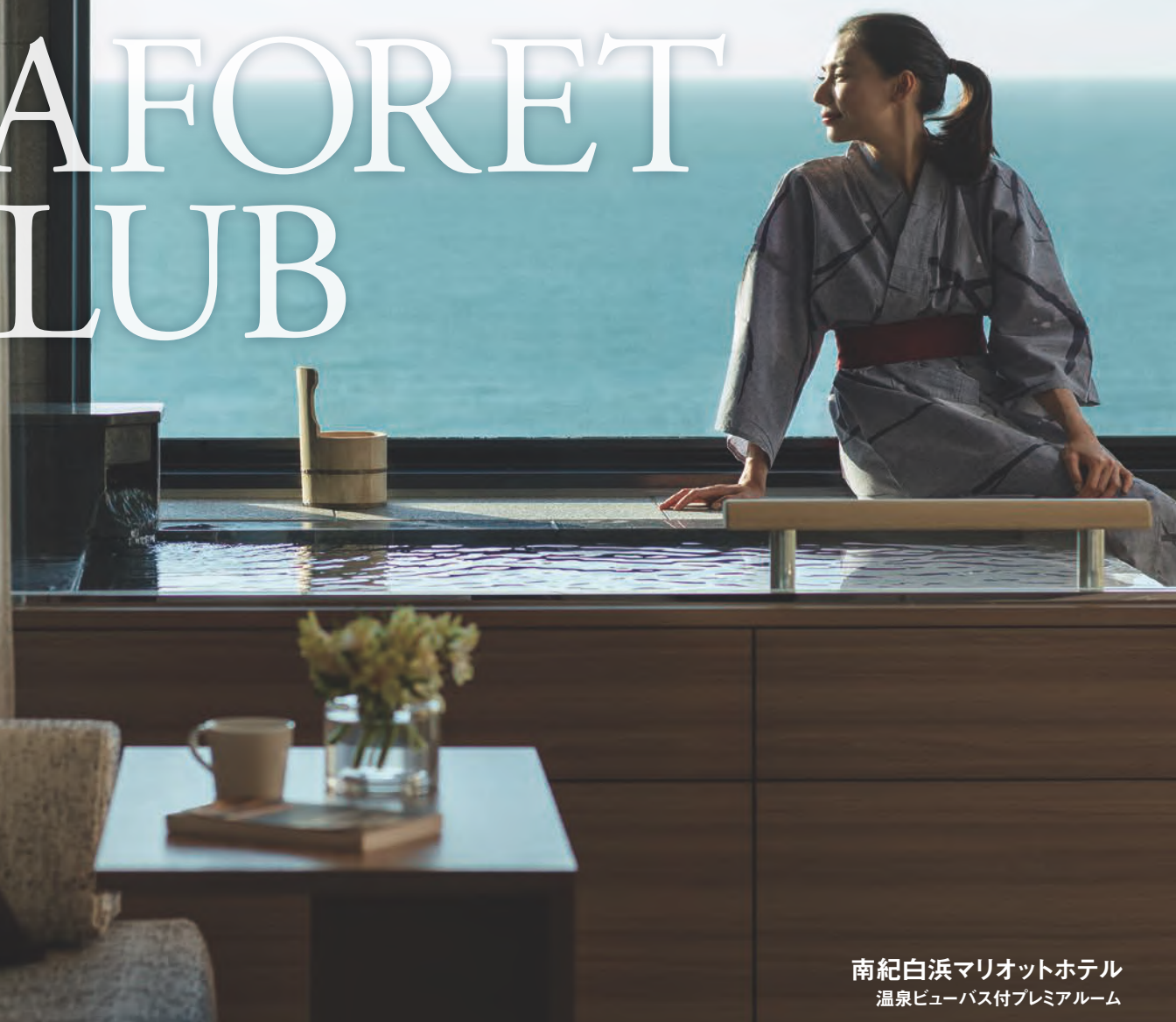
南紀白浜 Marriott ホテル 温泉ビューバス付プレミアムルーム