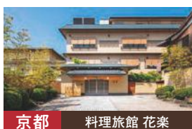
京都 料理旅館 花楽